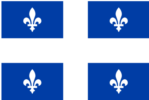
Drapeau du Québec